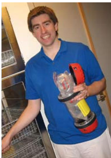
Først i Norge, muligens også i Europa! I spesiellagde poser og patroner distribueres cytostatika per rorpost fra Sykehusapoteket i Trondheim.

– Tidvis har det vært en del venting, spesielt for polikliniske pasienter. Når alle nye rutiner fungerer, håper vi at de skal merke at ting går raskere.